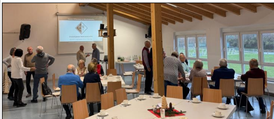
Gelungene Veranstaltung : Ehrenmitglieder Weihnachtskaffee